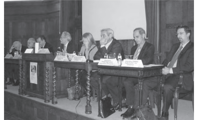
Αποψη με τους ομιλητές στην εκδήλωση

Αποτελεί μία χρηστική και έγκυρη έκδοση που αποδίδει με ακαδημαϊκή μεθοδικότητα και πολιτική οξυδερκεία αυτό που συχνά απουσιάζει από το ίδιο το πρωτογενές κείμενο: την απλότητα, τη σαφήνεια αλλά και την προβολή των αλλαγών στην ιστορικότητά τους.