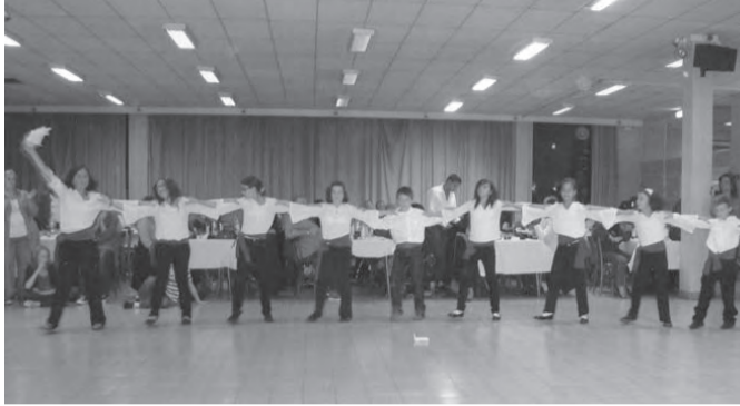
Αποψη από το παιδικό χορευτικό του Ελληνικού Κέντρου

Το Ελληνικό Κέντρο διοργάνωσε μουσικοχορευτική βραδιά το Σάββατο 03.10.09 στην αίθουσα «Aurore». Ήταν μια όμορφη εκδήλωση, τόσο από πλευράς οργάνωσης, όσο και περιεχόμενου, παρά την περιορισμένη και αναμενόμενη προέλευση κόσμου λόγω των επικείμενων εκλογών και την αναχώρηση συμπατριωτών μας στην Ελλάδα, αυτό όμως δεν εμπόδισε τους παρευρισκόμενους να περάσουν μια ξεχωριστή βραδιά.