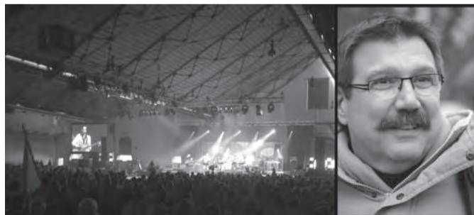
Αποψη από τη συγκέντρωση και στο ένθετο ο Γεν. Γραμματέας κ. Claude Rolin

Στη διαδήλωση συμμετείχαν και εργαζόμενοι σε προβληματικές επιχειρήσεις, όπως η Sonaca η Arceelor, και, εργαζόμενοι που ανησυχούν ιδιαίτερα για το μέλλον τους. ■