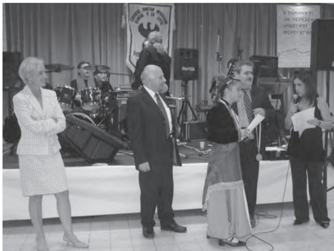
Η κυρία Γενικός, ο επίτιμος και ο νέος πρόεδρος και η Γραμματέας του Δ.Σ. κατά την απονομή

26 Σεπτεμβρίου στην «Salle Aurore», το 32 ο έτος ύπαρξής του καθώς και την απονομή βραβείων στα παιδιά του χορευτικού συγκροτήματος για την συμμετοχή τους στο 28ο φεστιβάλ ποντι-