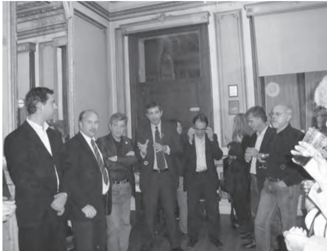
Διακρίνονται μεταξύ άλλων οι ευρωβουλευτές κ.κ. Στάυρος Λαμπρινίδης, Σπύρος Δανέλλης και Μιχαήλ Τρεμόπουλος

Παρευρέθηκαν οι Ευρωβουλευτές Λαμπρινίδης, Δανέλλης, Παπανικο-