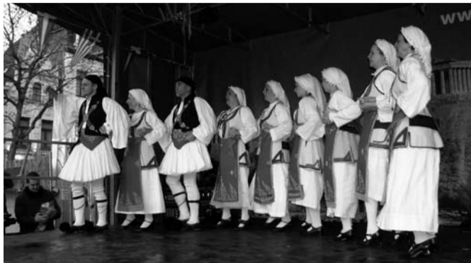
Παρουσίαση Πελοποννησιακών χορών από το χορευτικό συγκρότημα του Λυκείου Ελληνίδων

ματος, οι εκπρόσωποι της Περιφέρειας Πελοποννήσου, προσέφεραν στους συντελεστές της εκδήλωσης υπέροχες αναμνηστικές γκραβούρες διαφόρων τοπίων και πόλεων της Πελοποννήσου.