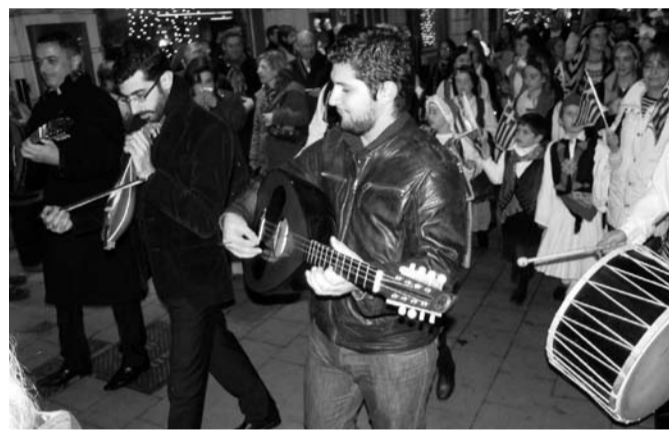
Στιγμιότυπο από την πορεία με επικεφαλής το Κρητικό Συγκρότημα "Τα Βλαμάκια"

Η εναρκτήρια εκδήλωση ξεκίνησε με το τραγούδι του Γιάννη Μαρκόπουλου Την Εικόνα Σου, που ερμήνευσε ο Αλέξανδρος Μπελλές, στην κατάμεστη από κόσμο και διάσημη Χρυσή Πλατεία των Βρυξελλών. Ο Δήμαρχος της ευρωπαϊκής πρωτεύουσας κ. Freddy Thielemans