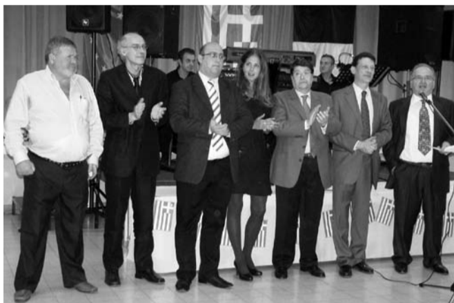
Μέλη του Δ.Σ. της Ελληνικής Κοινότητας Βρυξελλών

Εκεί ψάλλθηκε τρισάγιο στη μνήμη τους και ακολούθησε κατάθεση