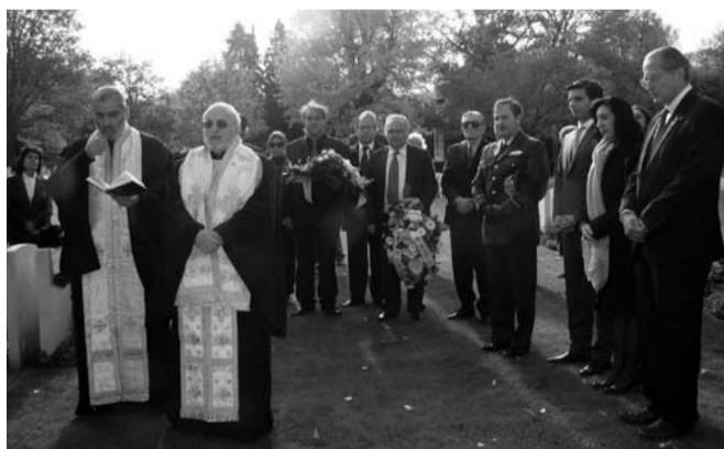
Αποψη από το Τρισάγιο και την κατάθεση στεφάνων στα μνημεία των Ελλήνων στρατιωτικών στο Νεκροταφείο του Evere

Ανάλογες εκδηλώσεις έλαβαν χώρα και σε άλλες πόλεις του Βελγίου, στη Λιέγη, στο Ζαρλερούα κ.α., που διοργανώθηκαν από τις κατά τόπου